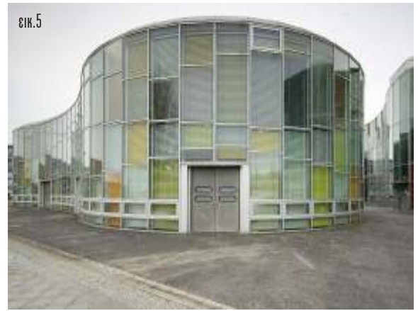
Photonic Centre ( .5)